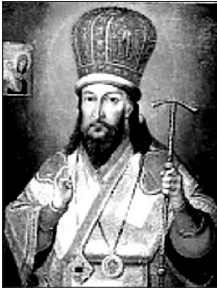
Свят. Димитрій РОСТОВСЬКИЙ