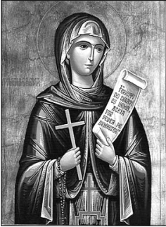
Преподобна Параскева Сербська